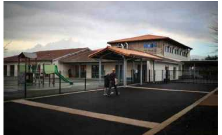
L'accès se fera par l'arrière en cas d'inondation.

Saint-Vincent-de-Paul, ses 1 000 habitants, sa petite école et désormais, sa zone refuge anti-inondation, la première du genre construite en France. Une petite ville qui multiplie les premières puisque c'est là que bientôt le groupe Hermès implantera ses nouveaux ateliers, créant des centaines d'emplois.