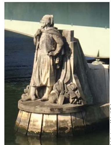
Le zouave de Paris sous le Pont de l'Alma