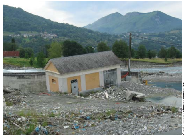
Barrage amont du Lac des Gaves dans les Hautes-Pyrénées suite à la crue de juin 2013

Philippe Lacordais - Délégation IFFO-RME Midi-Pyrénées