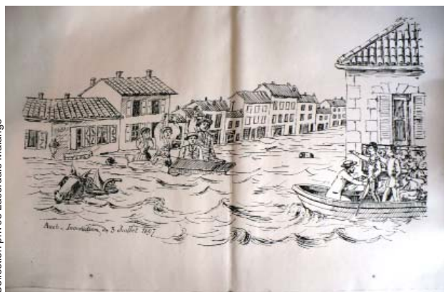
Illustration "Auch - Inondation du 3 juillet"